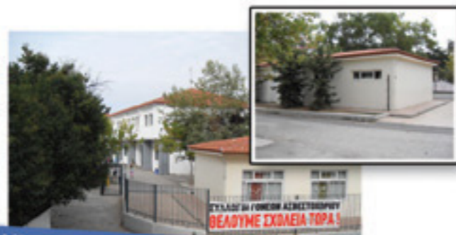
Αίθουσες προκάντ μέσα στο μοναδικό πάρκο του Ασβεστοχωρίου