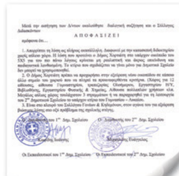
Απόσπασμα από το πρακτικό του Συλλόγου Διδασκόντων 1ου & 2ου Δημοτικού Σχολείου Ασβεστοχωρίου

Γιατί κύριε Δήμαρχε εμμένετε στη λύση του 5Χ5 και δεν προχωράτε τόσο καιρό στην υπόδειξη κατάλληλου οικοπέδου για την ανέγερση ενός σύγχρονου σχολείου;