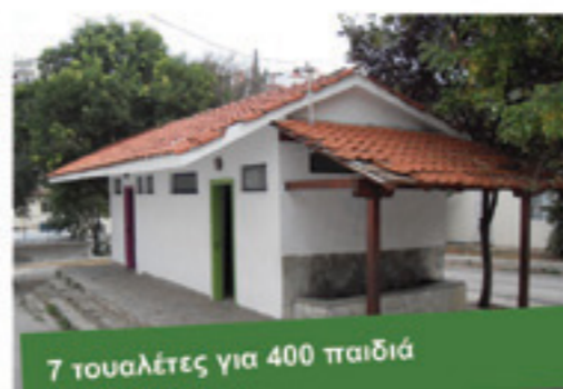
7 τουαλέτες για 400 παιδιά