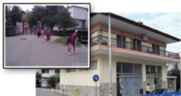
Αίθουσες σε νοικιασμένα μαγαζιά πάνω στον κεντρικό δρόμο του χωριού