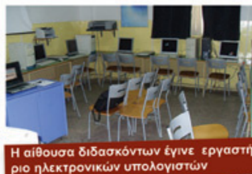
Η αίθουσα διδασκόντων έγινε εργαστήριο ηλεκτρονικών υπολογιστών