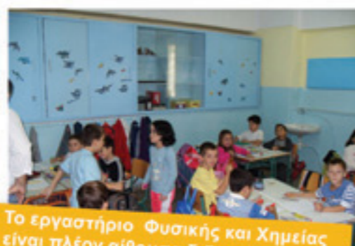
Το εργαστήριο Φυσικής και Χημείας είναι πλέον αίθουσα διδασκαλίας