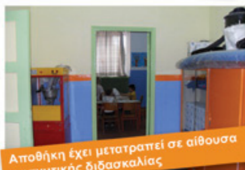
Αποθήκη έχει μετατραπεί σε αίθουσα ενισχυτικής διδασκαλίας