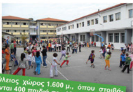
Αύλειος χώρος 1.600 μ., όπου στοιβάζονται 400 παιδιά σε κάθε διάλειμμα