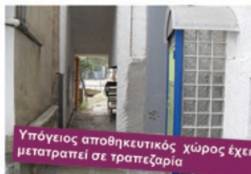
Υπόγειος αποθηκευτικός χώρος έχει μετατραπεί σε τραπεζαρία